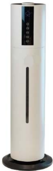
10 (Volume de pièce 50-200 m3)

Avec l'appareil H Hygiène 50-200 en combinaison avec la solution NeutroDes AIR prête à l'emploi, le risque d'infection par gouttelettes dans les pièces fermées peut être massivement réduit. La désinfection de surface à effet prolongé désinfecte toutes les surfaces de la pièce, de sorte que vous pouvez vous concentrer à nouveau sur le nettoyage. Ce procédé unique inactive les virus et les bactéries présents dans l'air sous forme d'aérosols - tout au long de la journée.